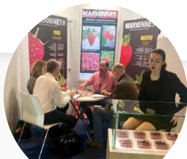
Fruit attraction MADRID

3 nouvelles sélections remontantes 4 nouvelles sélections non-remontantes